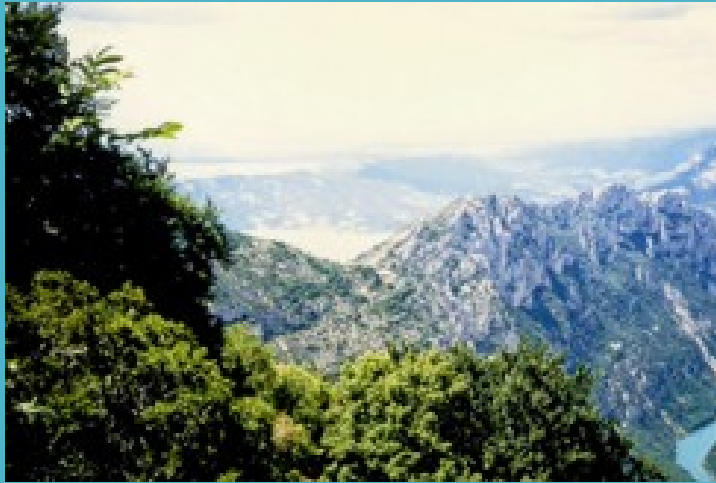
Dans les Gorges du Verdon, avec son client de 1983