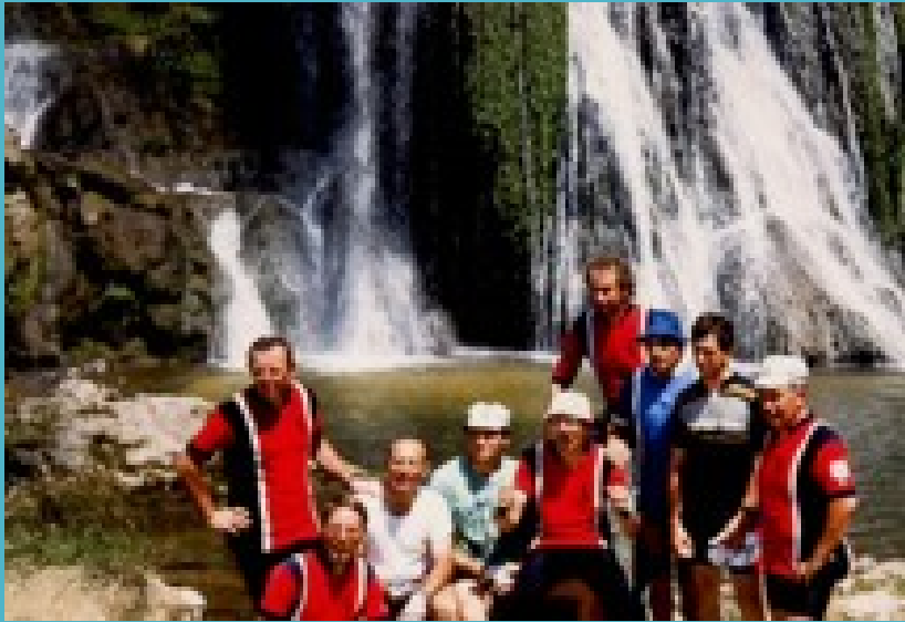
Devant la cascade de Glandieu (Ain)