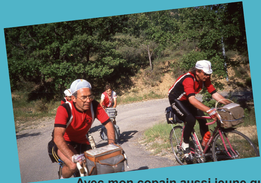
Avec mon copain aussi jeune que moi au club MSD CYCLO