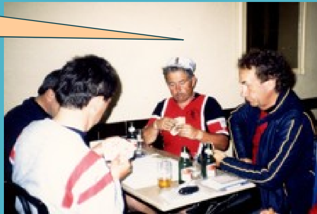
Violent orage à Pont Du Loup

A MSD CYCLO, on joue même à la belotte lors de la dernière étape avant d'arriver à Nice !