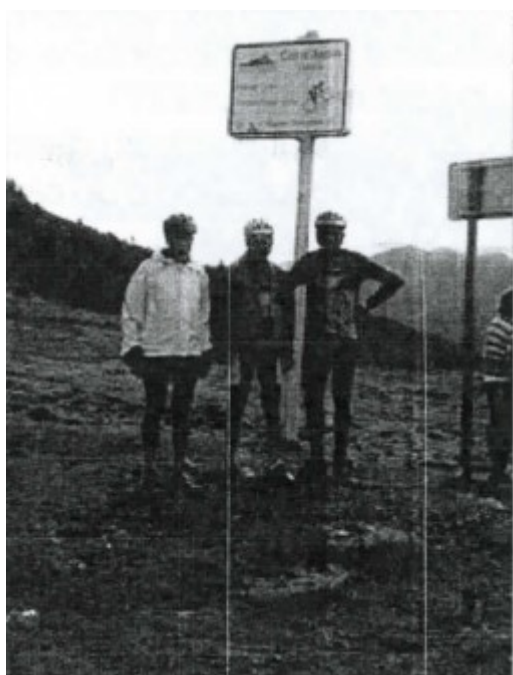
au sommet de l'Aspin

Lundi, grosse journée : le col d'Aspin, 1.489 m, et le Tourmalet, 2.115 m.