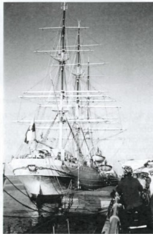
le légendaire trois mâts Dar Pomorza construit en 1909, aujourd'hui transformé en bateau-musée, propriété de l'Université maritime de Gdynia (Pologne)

Après un départ très matinal d'Alsace, première étape en bus vers Berlin. Le soir même, visite de cette ville moderne. Le lendemain, direction Gdansk au bord de la mer Baltique. L'après-midi, premiers coups de pédale en Pologne : une cinquantaine de kilomètres autour de la ville jusqu'à Sopot, station balnéaire très appréciée des Polonais ; très nombreuses pistes cyclables.