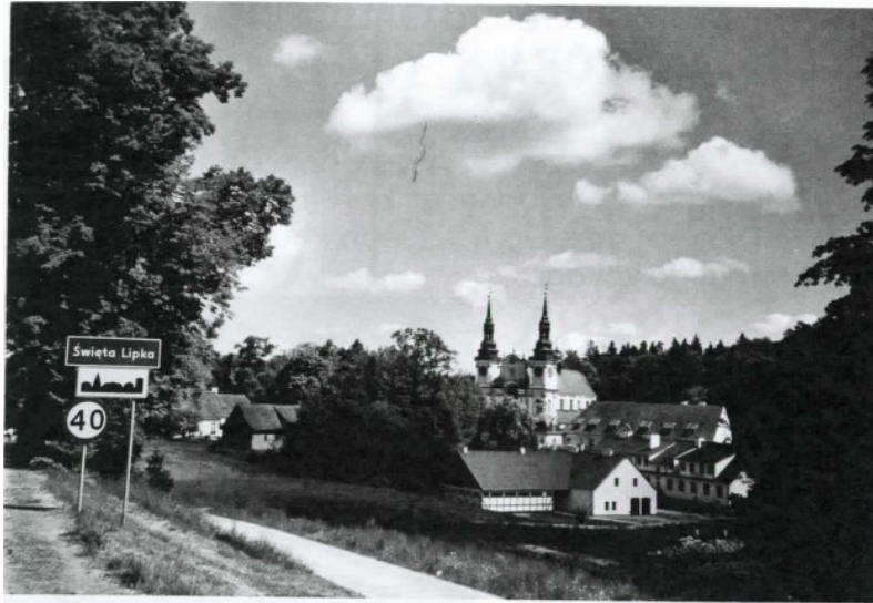
sanctuaire marial baroque de Swieta Lipka (Pologne)

Le lendemain, sous un temps gris, la sortie de Gdansk fut assez laborieuse. Puis nous voilà partis pour 120 km ou un peu plus pour certains (il fallait suivre le guide !). Tous les villages que nous traversons sont construits en bois.