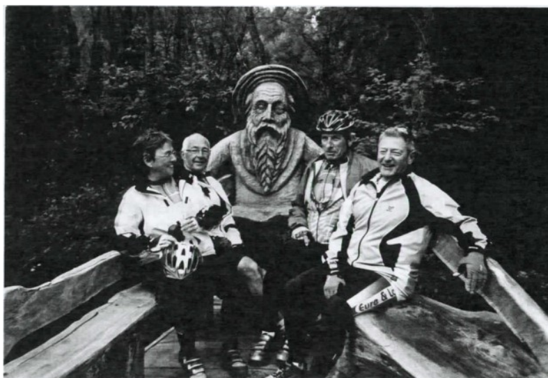
le parc de Verkiai (Lituanie)