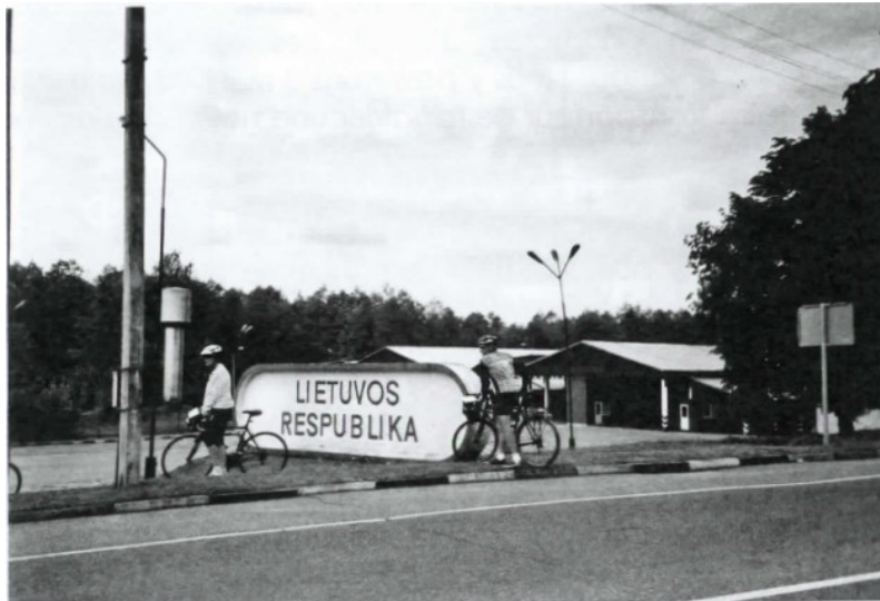
passage de frontière...

Au lever, temps très gris et froid. Après quelques km, visite du parc de Grutas avec ses statues géantes et le musée du Communisme. Le midi, pique-nique (il ne fait vraiment pas chaud !). L'après-midi, nous visitons plusieurs villages dont un avec un parc tout aménagé de sculptures plus ou moins énormes, façonnées dans des troncs d'arbres (splendide).