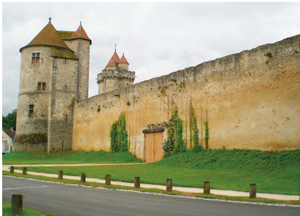
BLANDY LES TOURS - BPF 77 (Seine et Marne)